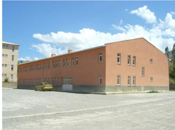
Yeni Bina B Blok